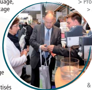
Exhibit at EUROCOAT 2011

If you are an expert in the following fields, then Eurocoat concerns you!