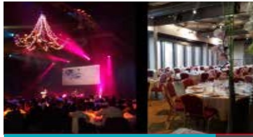
Le Liberté - L'Étage - RENNES 250 à 600 personnes en repas assis