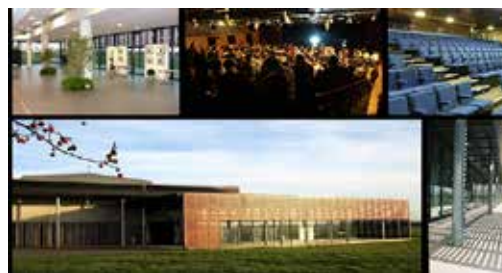
Le Zéphir - CHÂTEAUGIRON 80 à 400 personnes en repas assis