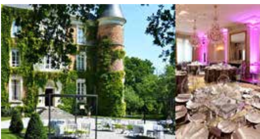
Chateau d'Apigné - LE RHEU 420 personnes en repas assis