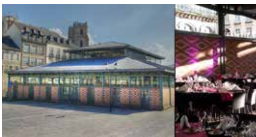
La Halle Martenot - RENNES 600 personnes en repas assis