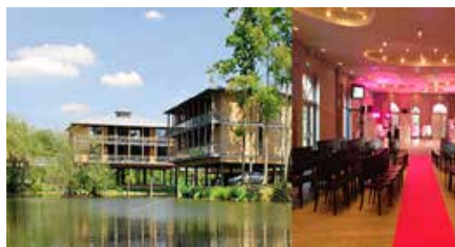
Domaine de Cissé Blossac - BRUZ 10 à 450 personnes en repas assis