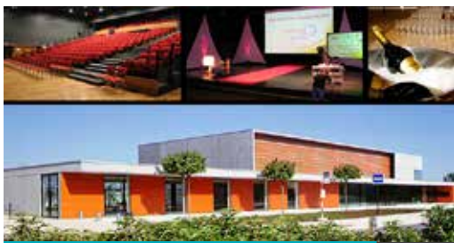
La Ponant - PACÉ 168 à 448 personnes en repas assis

Réalisations d'événements adaptés à votre image à proximité du Parc des Expositions. (recherche de lieux, organisation logistique, dîner de gala, séminaire, réunion, présentation de produits...)